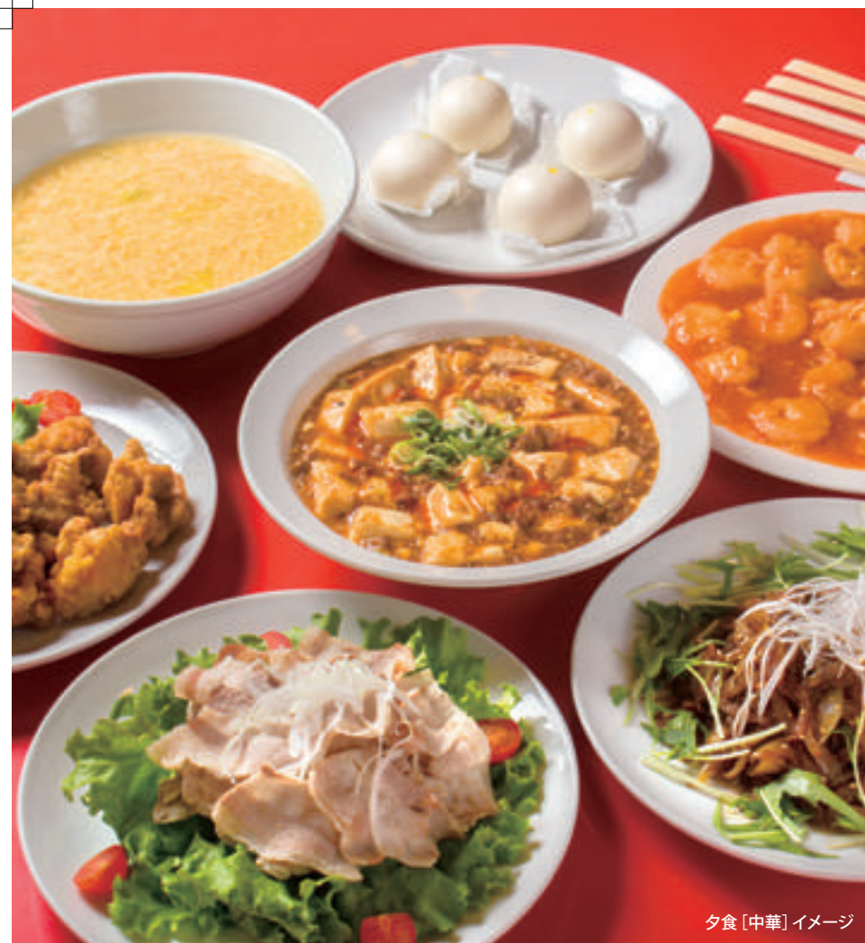
夕食[中華]イメージ