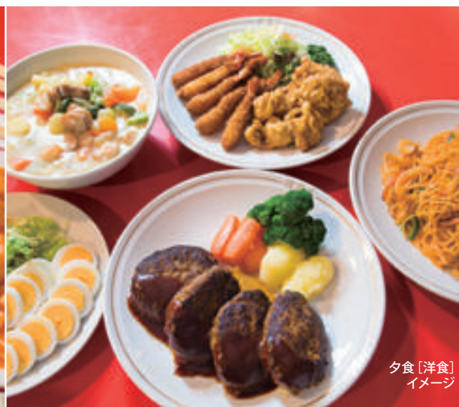
夕食[洋食]イメージ