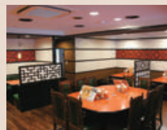
1F レストラン：中華飯店 鐘園亭