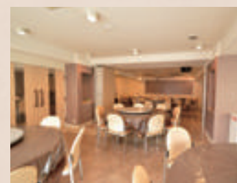
2F 宴会場兼研修会場

夕食・朝食 / 2F宴会場・1Fレストラン (その都度ご相談させていただきます)